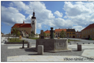
Vítково náměstí v Prčici