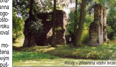
Kouty – zřícenina vodní tvrze