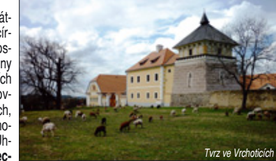
Tvrz ve Vrchotických