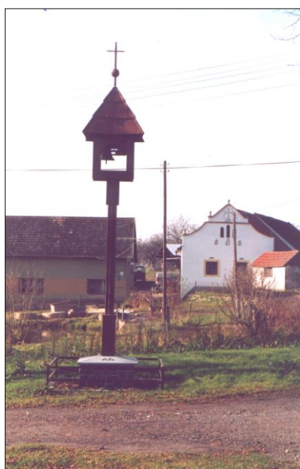
Nově instalovaná zvonička v Mrákoticích (město Sedlec-Prčice).

Cílem projektu je zatraktivnění území mikroregionu formou oprav kapliček a drobných sakrálních staveb ve venkovské krajině a vydání turistického průvodce „Putování za kapličkami Českého Meránu“. Ve spolupráci s členy Vlastivědného spolku ČESKÝ MERÁN byly připraveny textové a fotografické podklady pro tisk brožury v počtu 3000 ks. Na území obce Borotín byla opravena kaplička v Kamenné Lhotě, kaplička a zvonička v Libenicích, kaplička sv. Antonína u Borotína a opravena střecha márnice v Borotíně. V obci Jistebnice (lokality Žofín) byla provedena oprava střechy kapličky. V Mezně byla provedena montáž automatického zvonění v místní zvoničce a na hřbitově. V Nadějkově byla opravena jedna kaplička. Na území města Sedlec-Prčice jsme realizovali následující aktivity, které byly z Programu obnovy venkova podpořeny celkovou částkou 330.000,- Kč: celková oprava kaple v Šánovicích, oprava kapličky v Kvasejovicích a Vrchoticích, oprava a osazení elektrického zvonění na kapličkách v Mrákoticích a Přestavlkách. V osadě